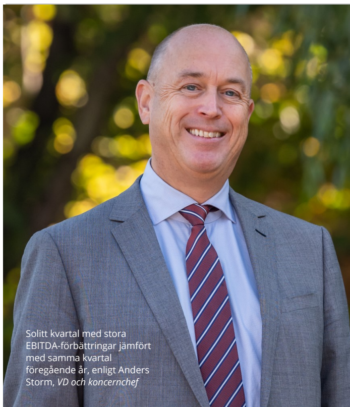
Solitt kvartal med stora EBITDA-förbättringar jämfört med samma kvartal föregående år, enligt Anders Storm, VD och koncernchef

Under kvartalet säkrade vi också ytterligare likviditet om cirka 80 miljoner kronor i form av bland annat lån och konvertibler som innebär att bolagets likvida medel och återstående outnyttjade lånefacilitet vid periodens utgång uppgår till totalt 78 miljoner kronor. I kombination med bolagets förväntade tillväxt anser vi att finansieringsbehovet för 2024 är tryggt. Precis som tidigare kommunicerats kommer vår tillväxt att variera över kvartalen. Efter sex kvartal av stark tillväxt och en mycket starkt år 2023 står vi nu i en kort period av konsolidering och förberedelse inför fortsatt tillväxt under andra halvåret. Historiskt har vi uppvisat en genomsnittlig tillväxt på mer än 40 procent och vi ser med tillförsikt fram emot att fortsätta den resan framöver. Vi har en förväntan om accelererande tillväxt under andra delen av den kommande treårsperioden, då volymproduktion kommer att driva bolagets organiska tillväxt genom att vi ökar andelen volymproduktion från dagens cirka 30 procent av omsättningen till över 80 procent i slutet av perioden 2026.